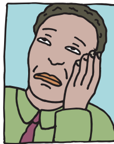
Dor de cabeça