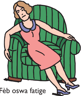
Fèb oswa fatige