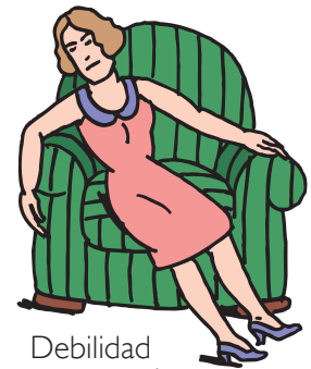
Debilidad o cansancio