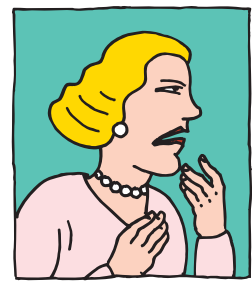
Ira o nerviosismo