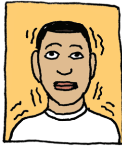
Temblores o mareos