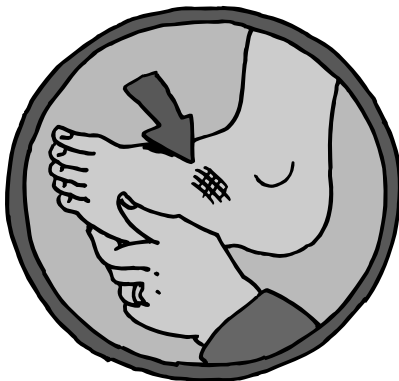
Heridas que no sanan