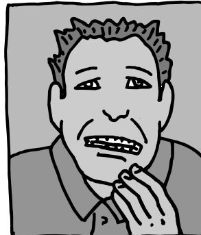
Problemas con el sexo