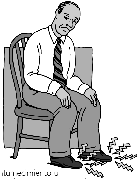
Entumecimiento u hormigueo de manos o pies.