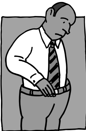
Pérdida de peso súbita