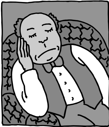
Cansado o soñoliento a menudo